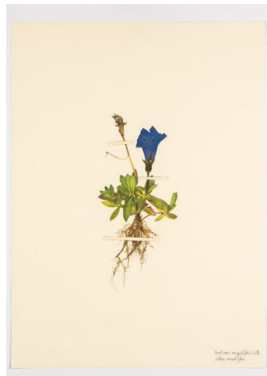
Dibuix d'Every missing flower

Per la seva banda, a la següent sala se situa la instal·lació The Wormholes . L'artista, fascinat pel patró de forats fets per diferents insectes a les fulles, trasllada aquests buits, que podem vincular a l'absència i fins i tot a la mort – de la fulla o de l'arbre – a notes musicals. L'artista col·loca les fulles foradades, que ell mateix ha recol·lectat a Lleida, en caixes musicals perquè el públic pugui interpretar una melodia. La peça ens remet a la importància d'aquests éssers vius a la cadena dels diferents ecosistemes. Zamora vol convertir l'acció dels insectes, que moltes vegades suposa un problema per als humans, en música amb l'objectiu de dialogar i empatitzar amb ells.