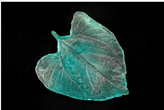
Peça pertanyent a Emerger la luz

Acompanyen la instal·lació una sèrie de set dibuixos realitzats amb una tècnica depurada i precisa, els quals permeten endevinar allò que no es veu, però que està viu i forma part fins i tot dels cossos humans, com les cèl·lules i els bacteris. Micrococs, estafilococs o estromatòlits, entre altres, prenen l'aparença d'elements que són familiars, com les plantes o els núvols.