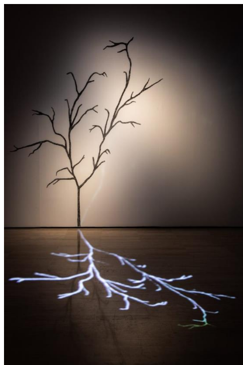
Un árbol y su sombra

En aquest espai se situa a més Encima y debajo de una farola , Premi ABC de l'Art 2009. L'obra combina tècniques com el vídeo, dibuix i fotografia sobre alumini, i barreja