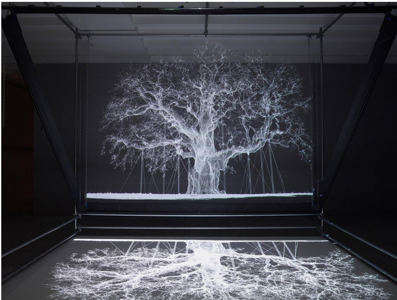
MAT COLLISHAW, ALBION. 2017

Madrid, 29 de març – El pavelló Villanueva del Real Jardín Botánico de Madrid acull la primera mostra individual a Espanya del creador britànic Mat Collishaw, on es presenta una acurada selecció de les seves obres. Mat Collishaw. Dialogues és la primera exposició organitzada per la Fundació Sorigué a Madrid.